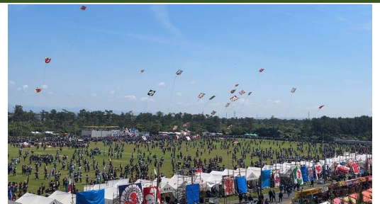
タウンジータザウンジン祭り

浜松まつりの凧揚げによく似たタウンジータザウンジン祭りを紹介します。ミャンマーのタウンジーという町で毎年11月下旬に行い、当日は午前中で動物の絵が描かれた熱気球を揚げ、夜は熱気球に花火を取り付けて揚げ、お釈迦様に敬意をあらわすお祭りです。浜松まつりに参加することで故郷を思い出してよかったと感じました。